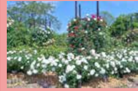
つるバラのタワー