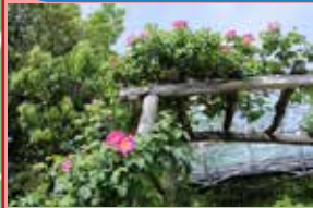
コンプリガータなど