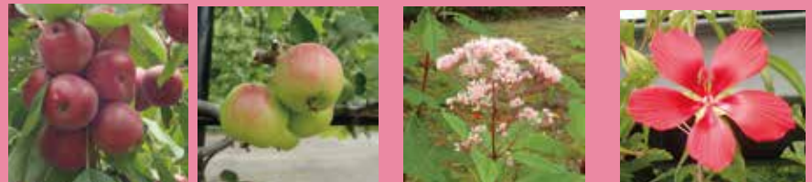
リンゴの実 ユーパトリウム モミジアオイ