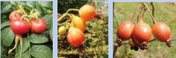
ハマナス アップルローズ ロサ・グラウカ