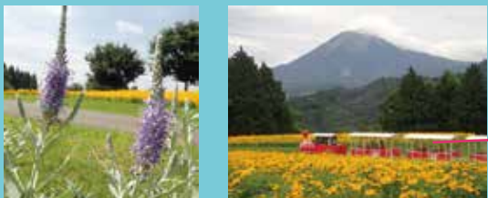
トウテイラン ルドベキア フレーリーサン