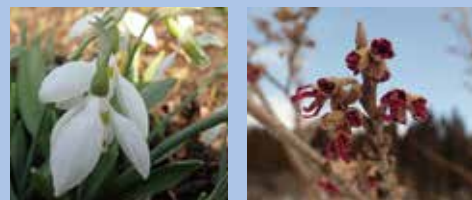
スノードロップ ★ アメリカマンサク