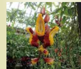
ツンベルギア・ マイソレンシス