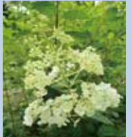
ノリウツギ "ミナツキ"