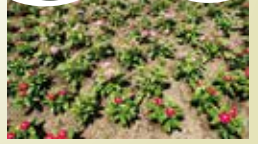
ピンカ、ペンタスなど (①西館テラス前花壇)