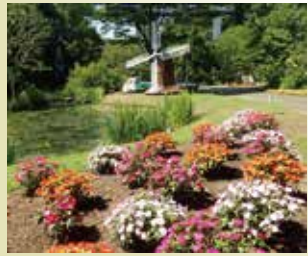
サンパチェンス (⑪花の谷)