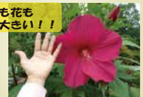
タイタンビカス (西出入口)