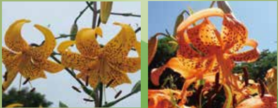
キヒラトユリ コオニユリ 6月中下旬が見ごろです!