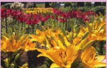
6月中下旬が見ごろです!