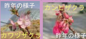
カワヅザクラ 昨年の様子 カンヒザクラ 昨年の様子

カワヅザクラ (プロムナード橋横) 3/20頃 カンヒザクラ (水上花壇横) 3/25頃、 ソメイヨシノは3/31頃開花予定です