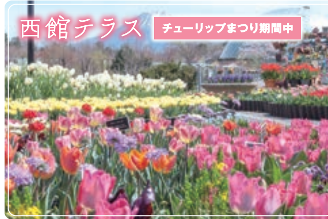
西館テラス チューリップまつり期間中