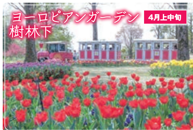
ヨーロッパンガーデン 樹林下 4月上中旬