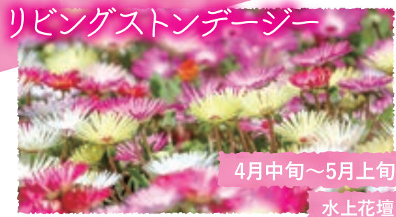
リビングストーンデージー