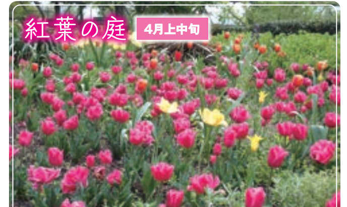
紅葉の庭 4月上中旬