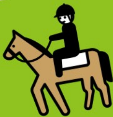
大山乗馬センター