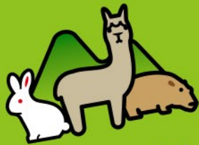
大山トムソーヤ牧場