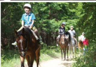
大山乗馬センター