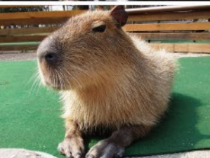
大山トムソーヤ牧場