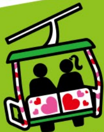
ますみず高原天空リフト